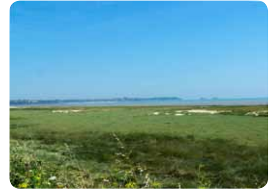
Baie du Mont-Saint-Michel - Saint-Benoît

Les logements et leurs annexes ne sont pas autorisés.